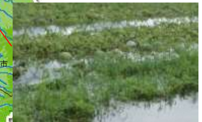
すいか畑の冠水 (尾花沢市荻袋)