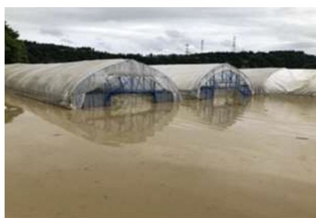
トマトハウスの浸水 (大蔵村白須賀)

県民生活の維持確保をはじめ、地域経済の安定に向け、豪雨災害に関する応急対策及び復旧対策に万全を期すため、特段の御配慮を賜りますようお願い申し上げます。