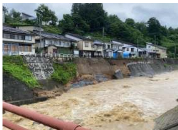
最上川支流銅山川堤防被災状況 (大蔵村肘折)