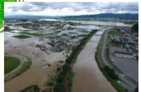
最上川支流大旦川内水氾濫状況 (村山市河島)