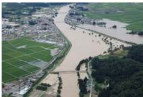
最上川本流氾濫状況 (大石田町横山)