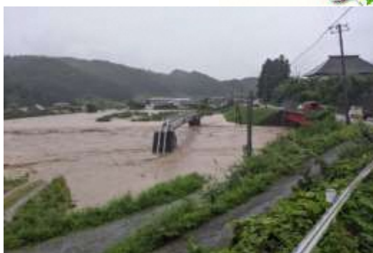
最上川支流月布川氾濫状況 (大江町荻野)