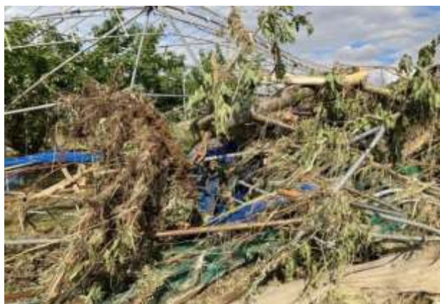
さくらんぼの樹体等の倒壊 (天童市高野辺)

耕作地への浸水やビニールハウス・用水路等の農業用施設への土砂流入、農地法面崩壊など、甚大な被害が出ています。