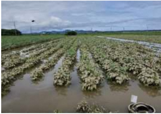
えだまめ畑の冠水(鶴岡市湯野沢)