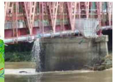
水道管の損傷状況 (舟形町堀内)