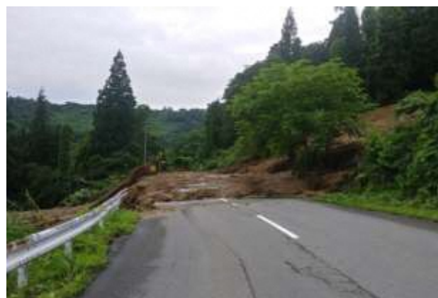
国道 458 号法面被災状況 (大蔵村大字南山字日陰倉)