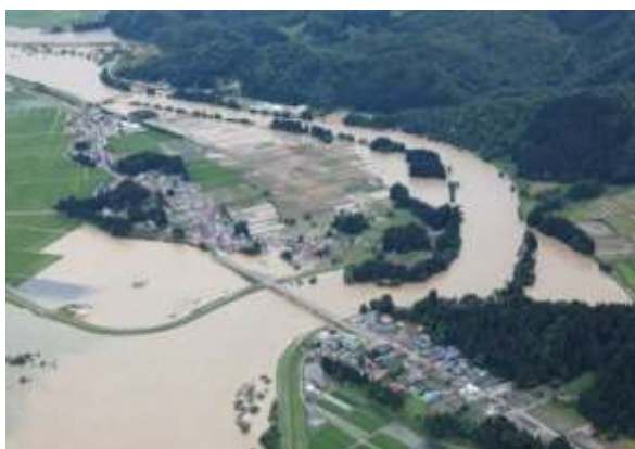
最上川本流氾濫状況 (大石田町豊田)

国直轄管理の一級河川である最上川氾濫により、県全域において、多くの箇所では護岸損壊や堤防決壊等が起きております。早期復旧と安全確保をお願いいたします。