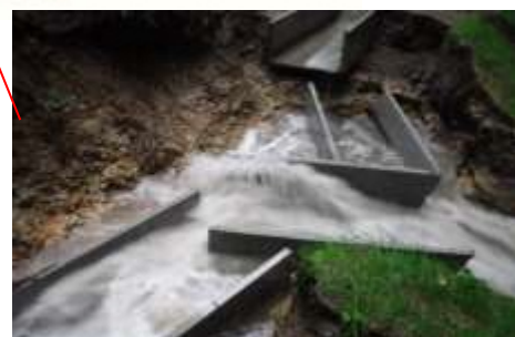
農業用水路の崩壊(米沢市館山矢子)