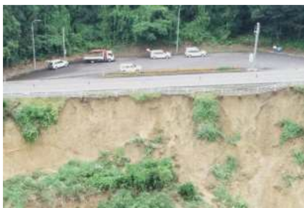
国道 348 号法面被災状況 (白鷹町滝野)

法面崩壊や土砂流出により、通行止め箇所が県内広域にわたり多くの路線箇所が発生するとともに、孤立集落が16地区発生するなど県民の生活・安全への影響が出ています。