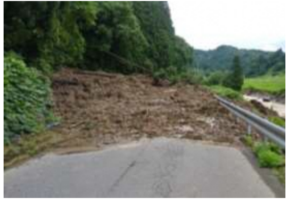
土石流被災状況(大蔵村大字南山字塩)