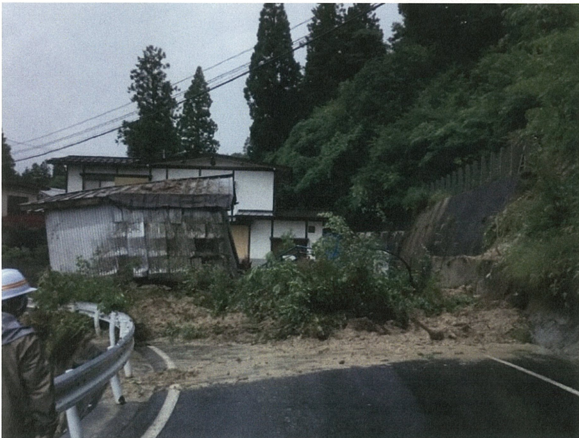
⑧ 寒河江市白岩（急傾斜地被災状況）