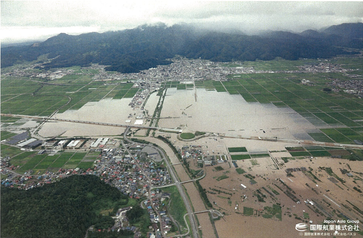
③ 村山市河島（大旦川・内水被害状況）