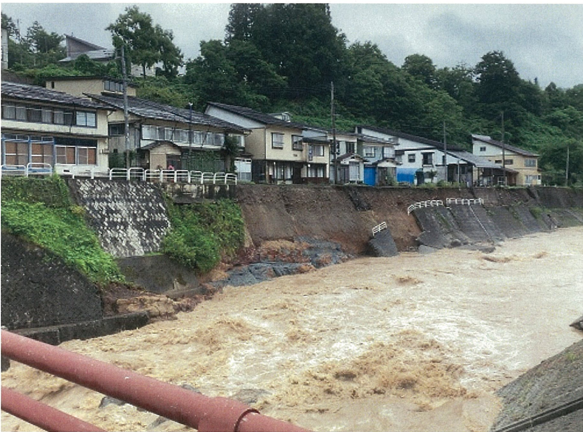
④ 大蔵村肘折（銅山川・堤防被災状況）