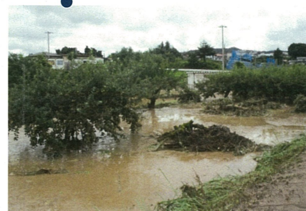
■浸水・土砂流入した西洋なし圃場（大江町小見）7/29 9:40