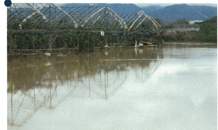
■浸水したおとう圃場（河北町溝延）7/29 9:00