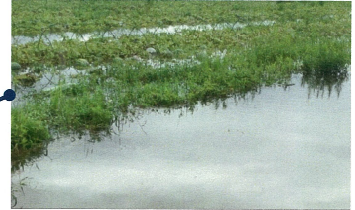
■冠水したすいか圃場（尾花沢市荻袋）7/29 8:00