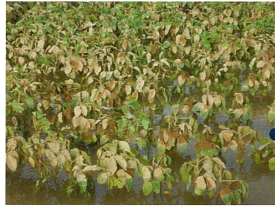
■冠水した大豆圃場（鶴岡市藤島）7/29 6:30