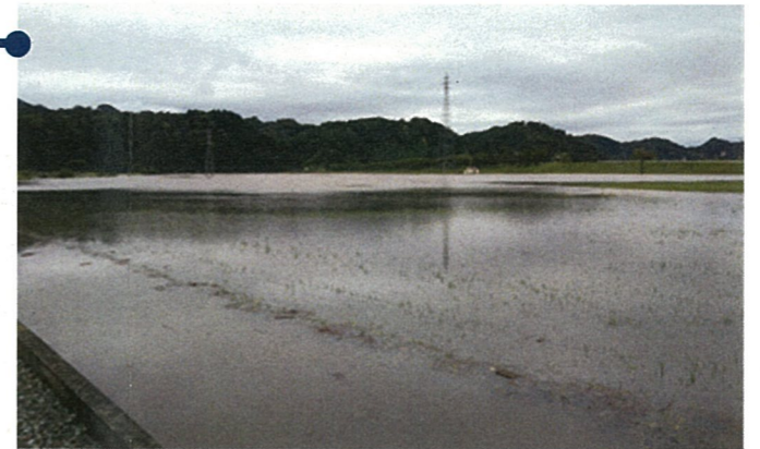
■冠水した水田（大石田町横山）7/29 7:20