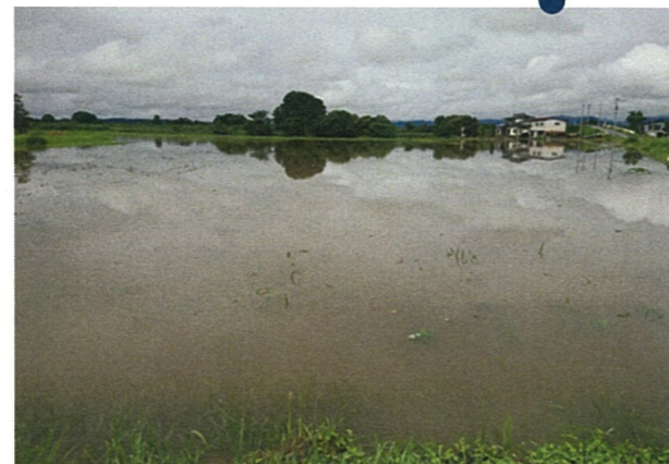
■冠水したえだまめ（川西町東大塚）7/29 10:00