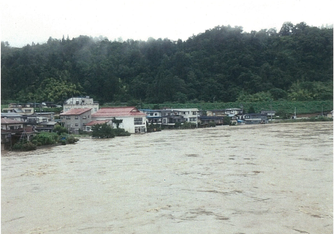
⑥ 大江町左沢（最上川・氾濫状況）