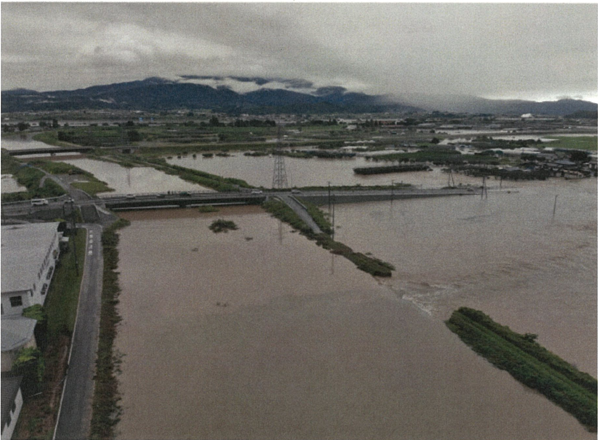
② 東根市長瀬（白水川・堤防決壊状況）