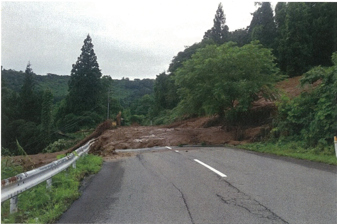
⑩ 大蔵村大字南山字日陰倉（国道458号・法面被災状況）