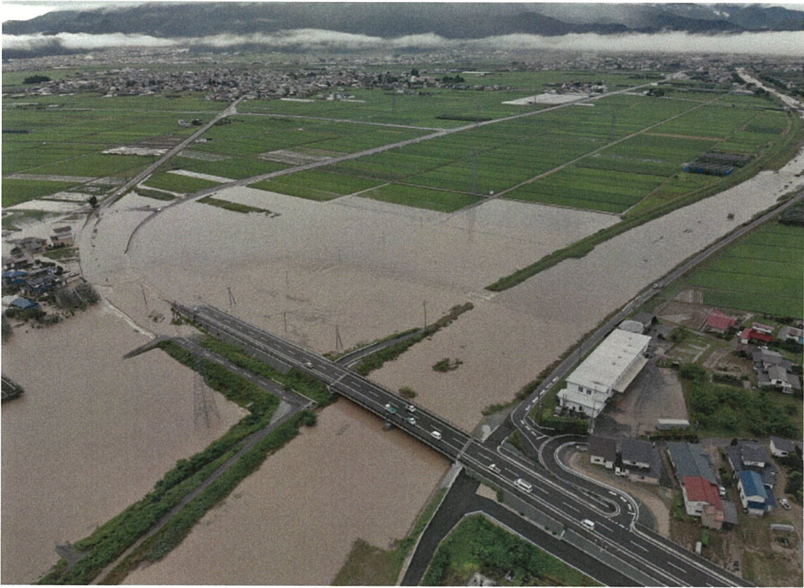
① 東根市長瀬（白水川・堤防決壊状況）