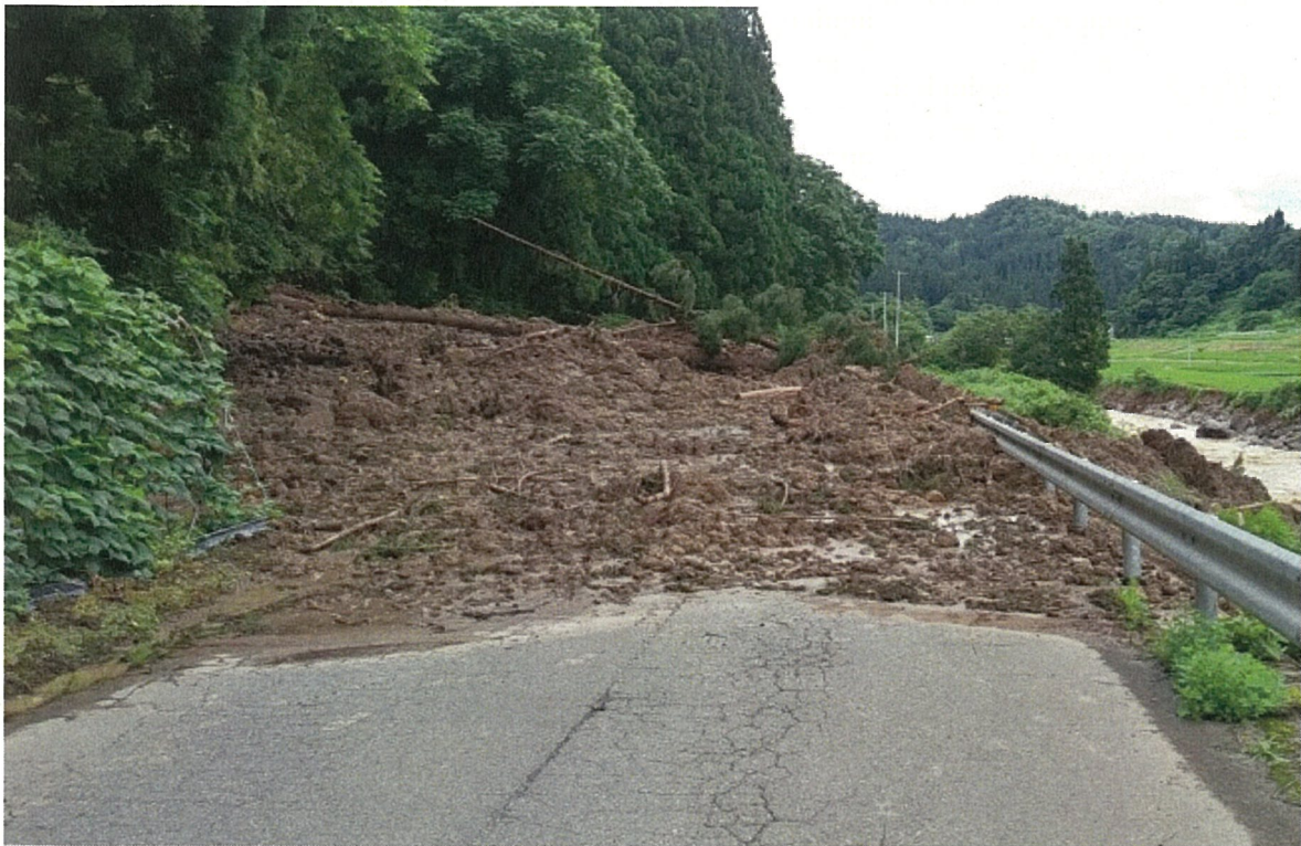
⑦ 大蔵村大字南山字塩（土石流被災状況）