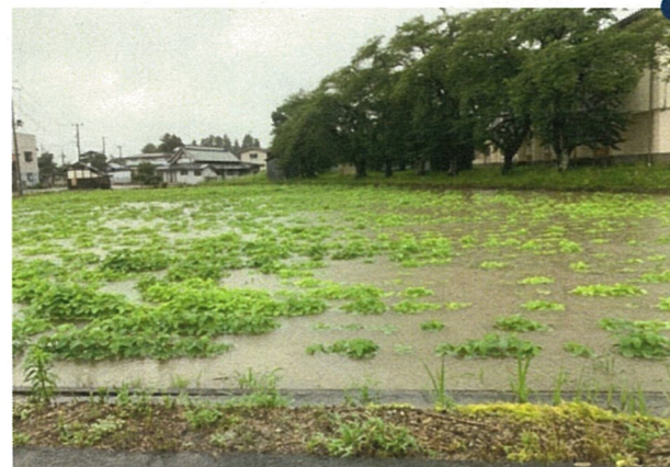
■浸水した大豆圃場（長井市成田）7/28 14:30