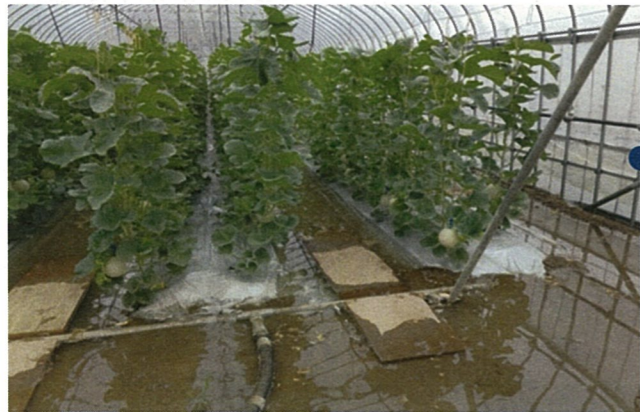
■浸水したメロンハウス（白鷹町鮎貝）7/28 16:30