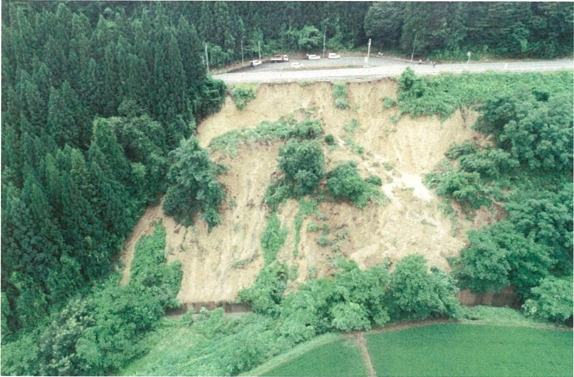
⑨ 白鷹町滝野（国道348号・法面被災状況）