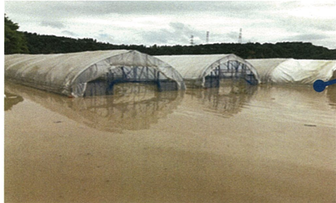
■浸水したトマトハウス（大蔵村白須賀）7/29 9:30