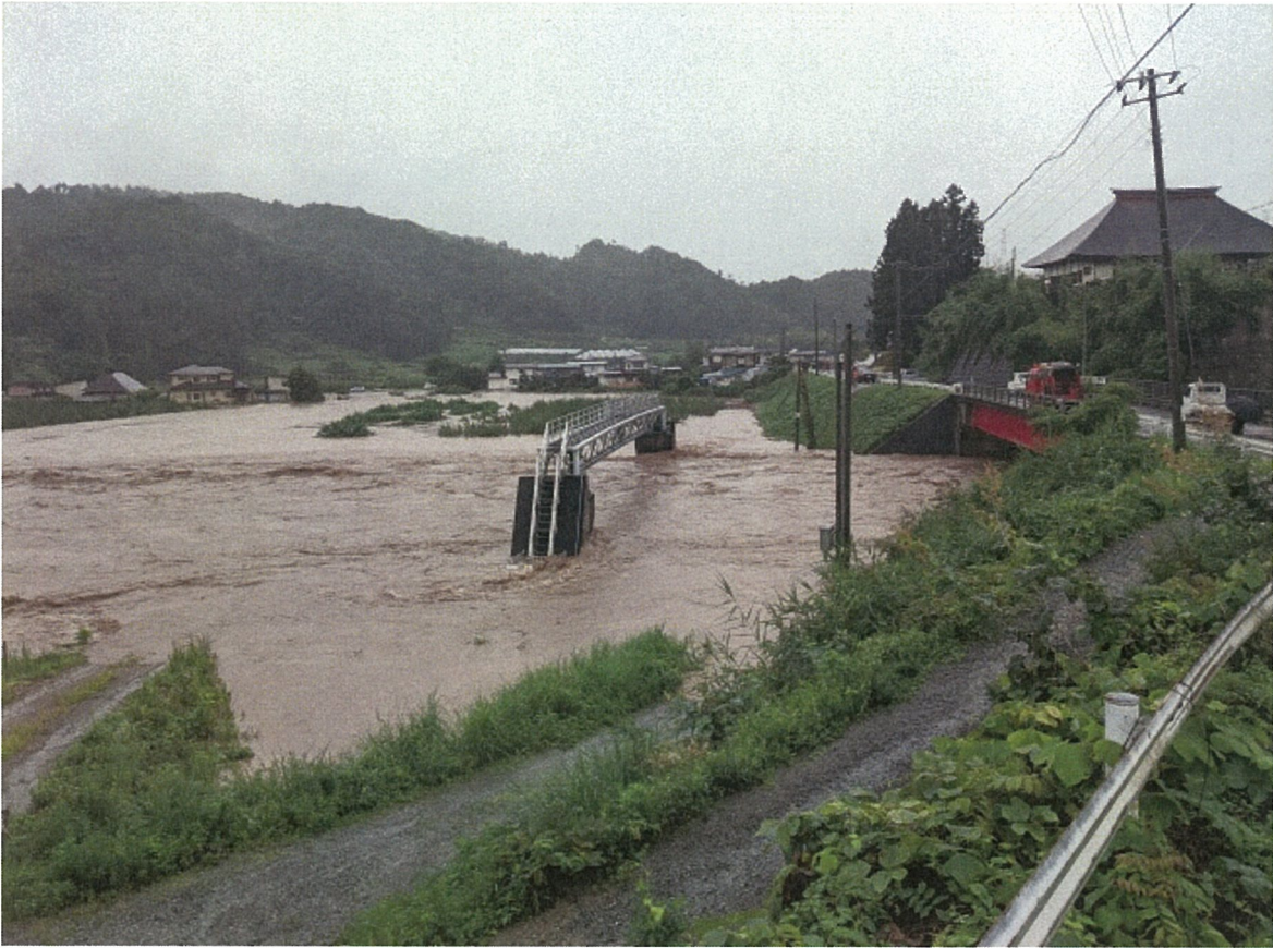
⑤ 大江町荻野（月布川・氾濫状況）