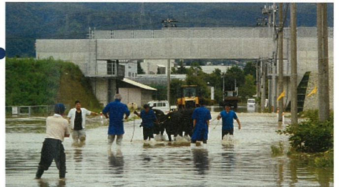
■浸水した牛舎から牛を避難（村山市大久保）7/29 17:00