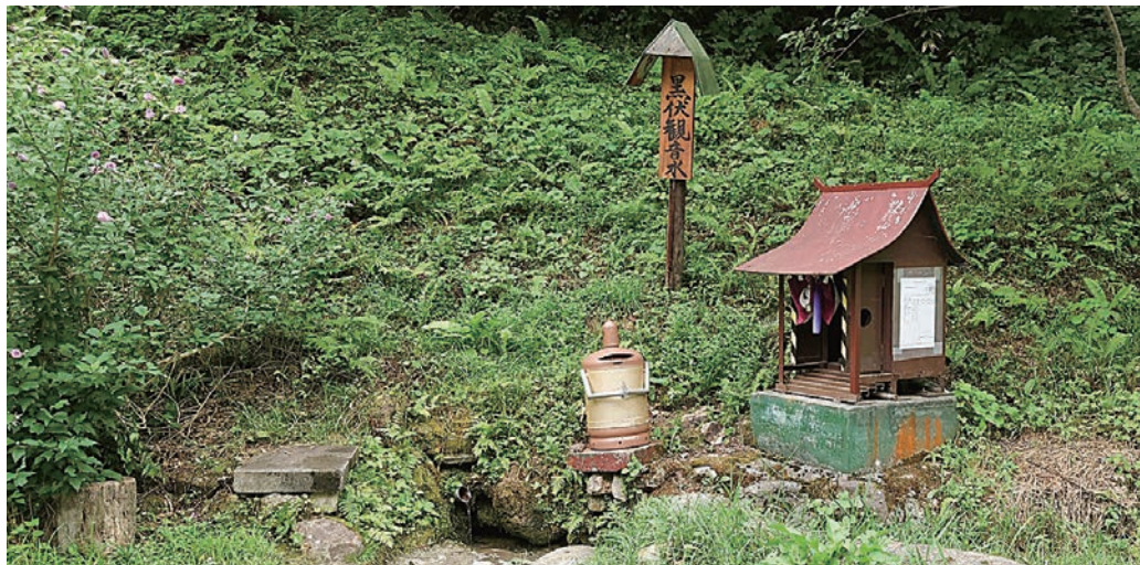
〔管理者・保全団体〕観音寺生産森林組合